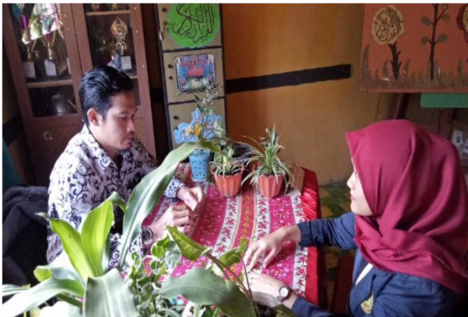
Gambar 1. Perizinan Pengabdian kepada Masyarakat dengan kepala sekolah SMP Swasta Anak Bangsa