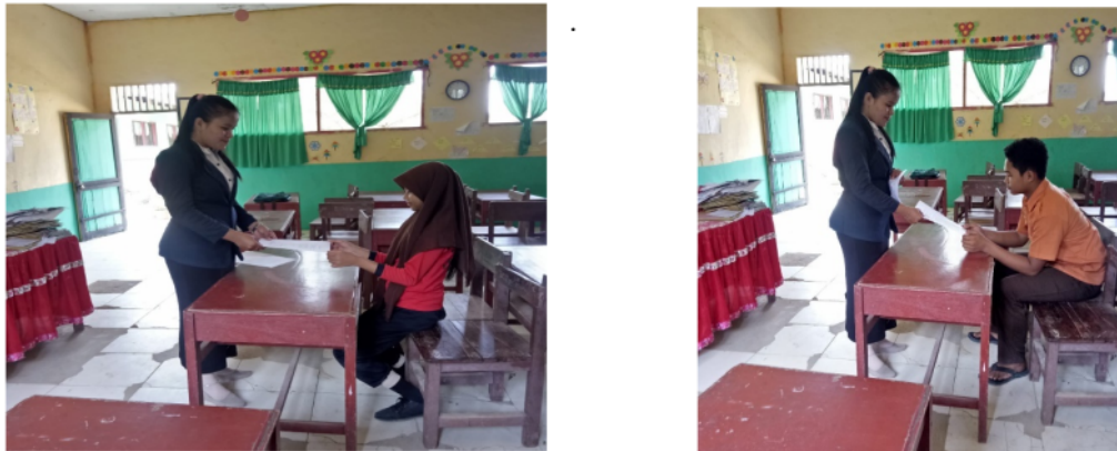
Gambar 2. Dokumentasi Kegiatan